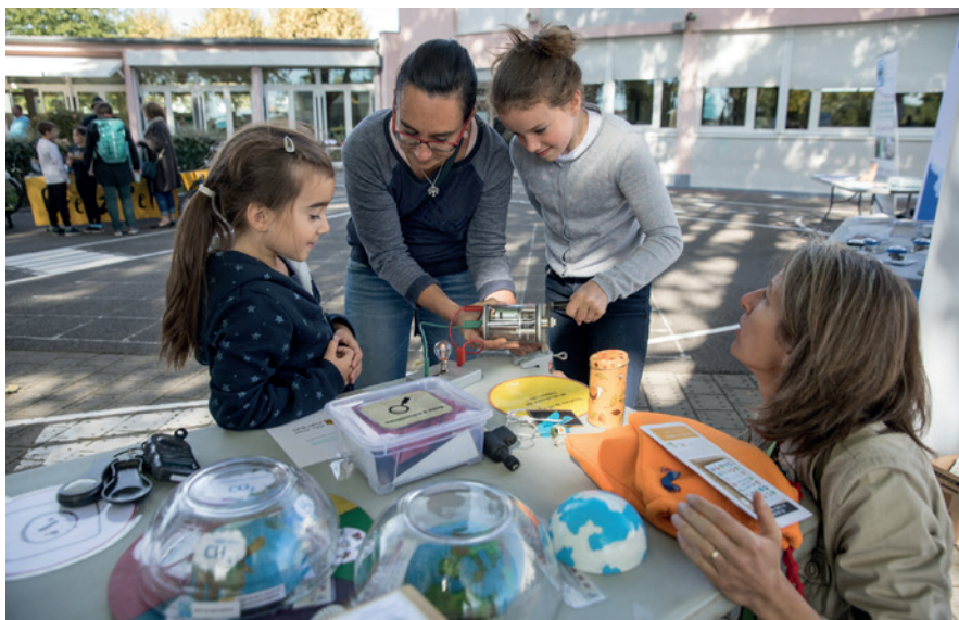
Forum 2018

Afin d'accompagner les acteurs du territoire dans leurs projets de sensibilisation et de mobilisation en faveur du développement durable, le forum professionnel d'Education à l'environnement a pour principaux objectifs de :